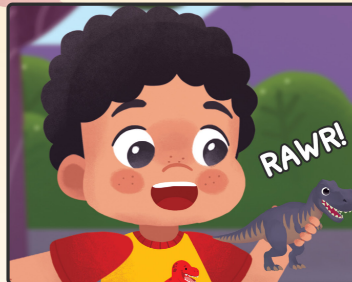
2. Made bermain dengan Dinonya.