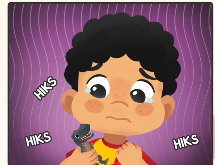
10. Made melihat Dino, "Tapi... kalau aku jadi Bona... aku juga akan marah jika ada yang rusakin Dino... Hikss... Dan aku lebih suka kalau ada yang minta maaf ke aku." Made pun terlihat lebih tenang.