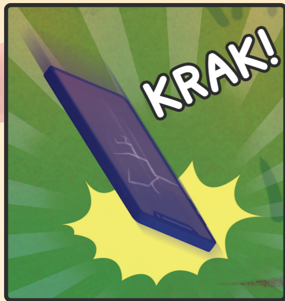
5. AAAAAA! Layar handphone Bona pecah dan langsung mati. Beep.