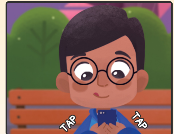
3. Sedangkan Bona bermain dengan handphone-nya.